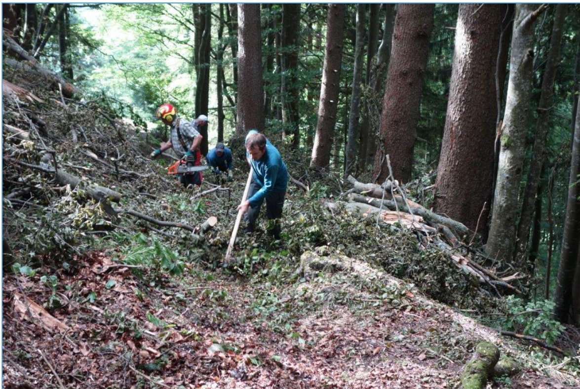
"Sturmholz-Putzete" von 15 umgestürzten Bäumen im Haselwald Alpnach