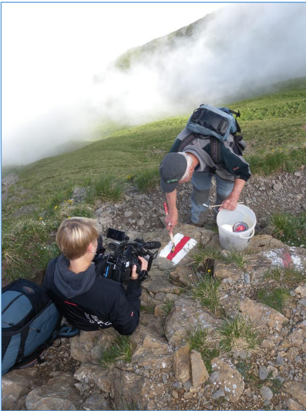
"Showtime" von Fredi Zeder für Alina Dekker Tele1 Foto: Alois Häcki Pro Pilatus